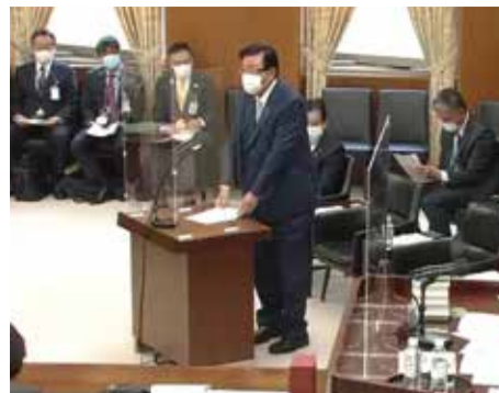
衆議院地方創生特別委員会で答弁に立つ長坂副大臣。