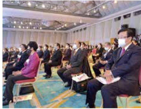
コロナ対策でソーシャルディスタンスをとって開催された2021年自民党大会に出席。写真左手は大島衆議院議長と山東参議院議長