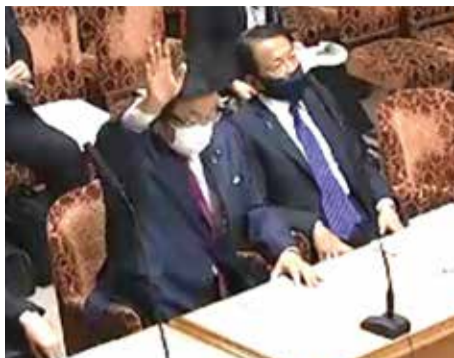
参議院財政金融委員会で麻生大臣と答弁に立つ長坂経産副大臣。