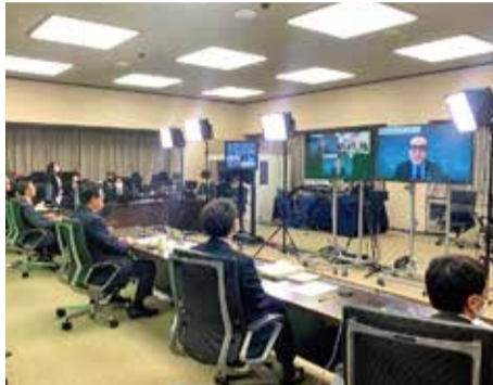
イスラエルイノベーションネットワーク総会Web会議に参加する長坂副大臣。