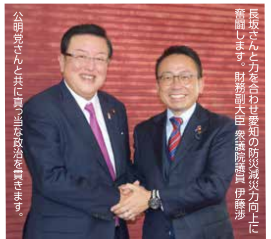
長坂さんと共に真に真の当な政治を貫きます。