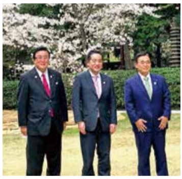
井上信治万博担当大臣と共に愛知地球博記念公園の視察と2025年万博をめざし空飛ぶクルマのスカイドライブ社を視察し、大村知事を知事公館に表敬。