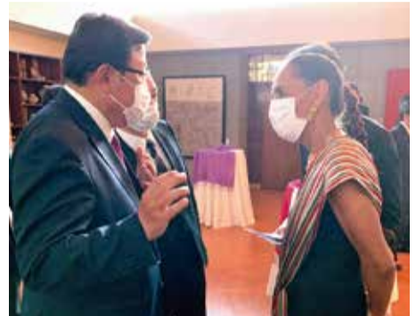
メキシコ大使館で行われた日、メキシコ経済連携協定EPA15周年記念レセプションに出席し、プーリア駐日メキシコ大使と意見交換する長坂副大臣。