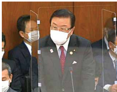
各種委員会に呼ばれ国会最優先で答弁に立つ長坂副大臣。