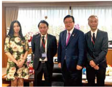
コメンテーターとしても活躍する国際政治学者の三浦瑠麗さんとアパレル産業に関する意見交換をする。