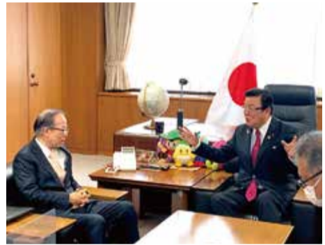
鎌原繊維産業連盟会長と繊維業界の現状と未来について意見交換する。